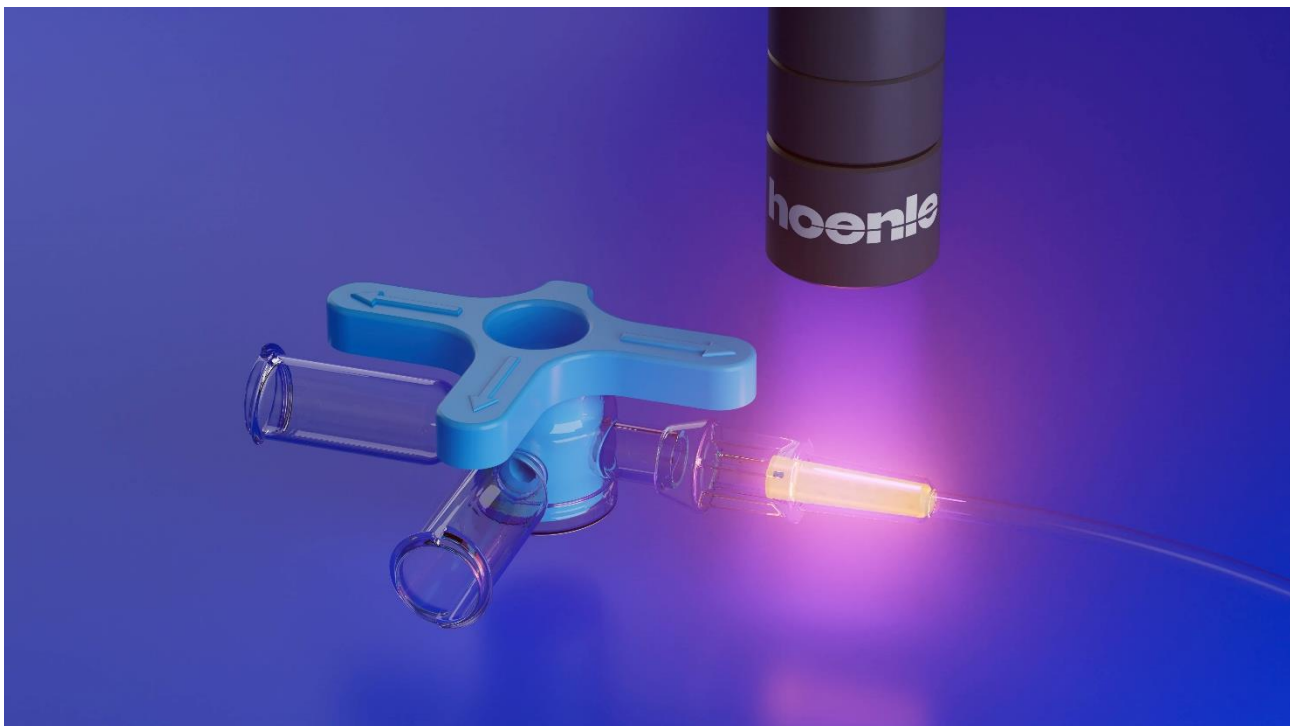
Ein orange fluoreszierender UV-Klebstoff, der die Schläuche verbindet, wird mit einer Hoenle bluepoint LED ausgehärtet.

Bei der Entwicklung einer neuen Generation von Klebstoffen für den Bereich Medizintechnik, war es das vorrangige Ziel, dass sich diese durch eine gute Verträglichkeit auszeichnen und die Arbeitssicherheit erhöhen. Konkret bedeutete dies, dass diese Klebstoffe TPO-frei (Trimethylbenzoyl Diphenylphosphine Oxide) und CMR-frei (cancerogen, mutagen, reproduktionstoxisch) sein sollten. Nach umfangreichen Labortests ist es gelungen, Klebstoffe mit CMR-freien Rohstoffen zu entwickeln, welche gleiche oder höhere Haftfestigkeit und Elastizität als die Originalprodukte aufweisen. Hoenle hat damit fortschrittliche UV-Klebstoffe für die Herstellung medizinischer Geräte auf den Markt gebracht, die auch gemäß der aktuellen REACH-Verordnung ECHA-konform (European Chemicals Agency) sind. Diese Hoenle-Klebstoffe sind als TPO/CMR-frei zertifiziert und reduzieren chemische Risiken am Arbeitsplatz und in der Umwelt. Sie eignen sich für die Verklebung von Kanülen, Kathetern, Blutentnahmesets und Diagnosegeräten. Diese neuen Klebstoffe erfüllen die Biokompatibilitätsprüfprotokolle der ISO 10993. Für die Herstellung von medizinischen Wearables hat Hoenle Adhesives UV-Klebstoffe entwickelt, die ohne IBOA formuliert wurden. IBOA ist ein haftungsförderndes Monomer, das mit Fällen von Hautreizungen in Verbindung gebracht wird. IBOA-freie Klebstoffe können die Gesundheitsrisiken sowohl für die Hersteller als auch für Nutzer von Wearables deutlich verringern.